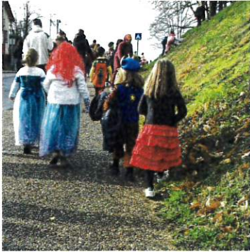
Carnaval des enfants